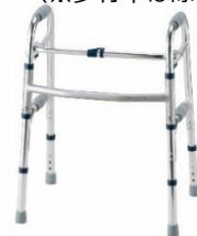
歩行器 （※歩行車は除く）

貸与告示第九項に掲げる「歩行器」のうち、脚部が全て杖先ゴム等の形状となる固定式又は交互式歩行器をいい、車輪・キャスターが付いている歩行車は除く。